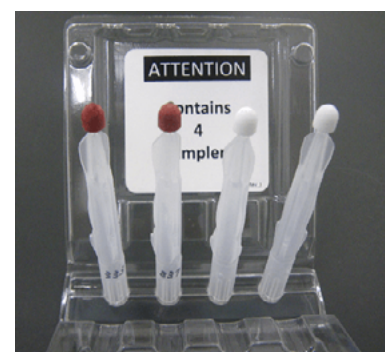
HemaTIP ™ マイクロサンプラー